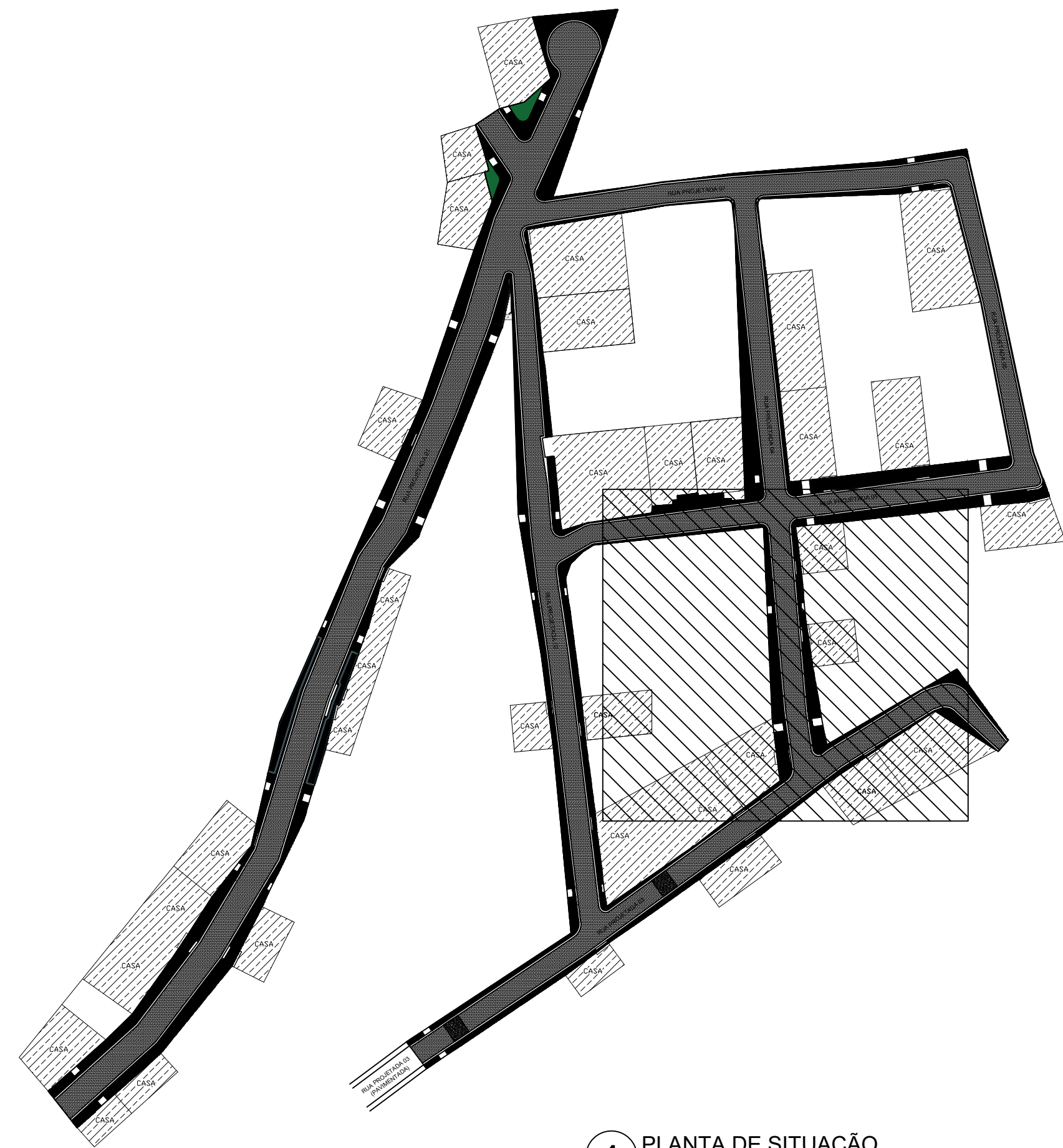
1 PLANTA DE SITUAÇÃO ESCALA 1/1000